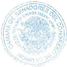
SEN. LAURA ITZEL CASTILLO JUÁREZ Presidenta

SALÓN DE SESIONES DE LA HONORABLE CÁMARA DE SENADORES.- Ciudad de México, a 15 de abril de 2026