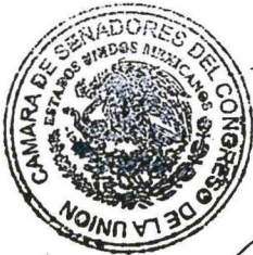
SEN. ALEJANDRO ARMENTA MIER Presidente

SALÓN DE SESIONES DE LA HONORABLE CÁMARA DE SENADORES.- Ciudad de México, a 13 de abril de 2023.