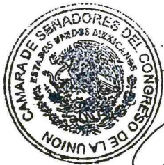
SEN. ALEJANDRO ARMENTA MIER Presidente

SALÓN DE SESIONES DE LA HONORABLE CÁMARA DE SENADORES.- Ciudad de México, a 13 de abril de 2023