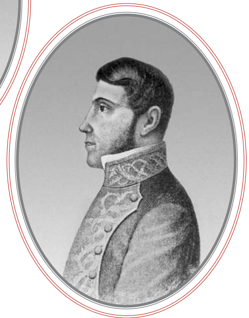
Juan Aldama 1774-1811