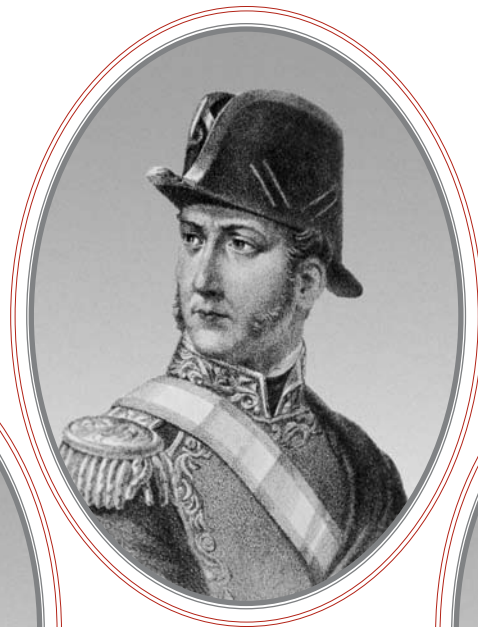
Ignacio Allende 1769-1811