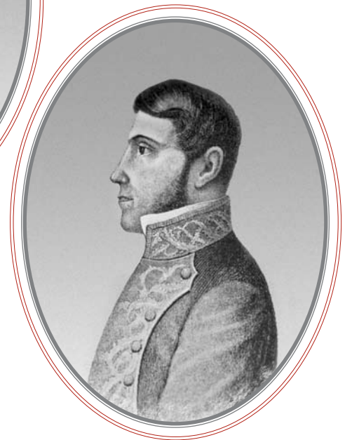
Juan Aldama 1774-1811