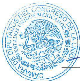
Dip. Kenia López Rabadán Presidenta

S A L Ó N DE SESIONES DE LA CÁMARA DE DIPUTADOS DEL HONORABLE CONGRESO DE LA UNIÓN. Ciudad de México, a 11 de noviembre de 2025.