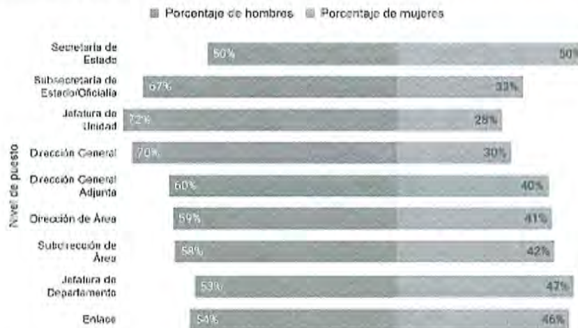
Porcentaje de hombres y mujeres por puesto y orden de jerarquía en las secretarías de Estado, 2021

Nota: No incluye información de la Sedena, la Semar y la Secretaría de Seguridad.