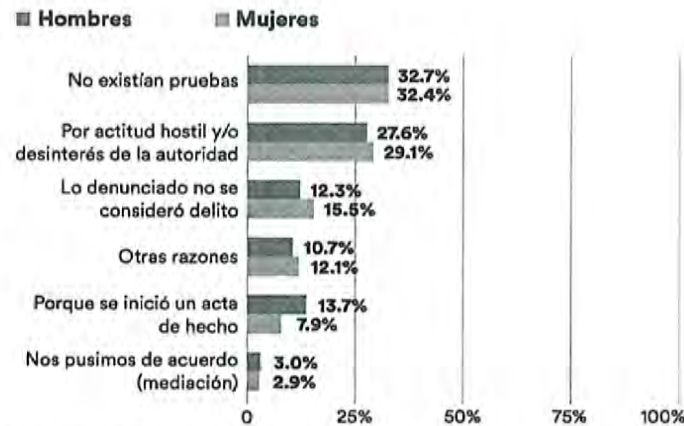
Razones principales por las cuales las víctimas de delitos no denunciaron ante el Ministerio Público.

mayor proporción que los hombres, como se muestra en la siguiente gráfica relativa a las razones por las cuales las víctimas de delitos no denuncian ante el Ministerio Público 4 :