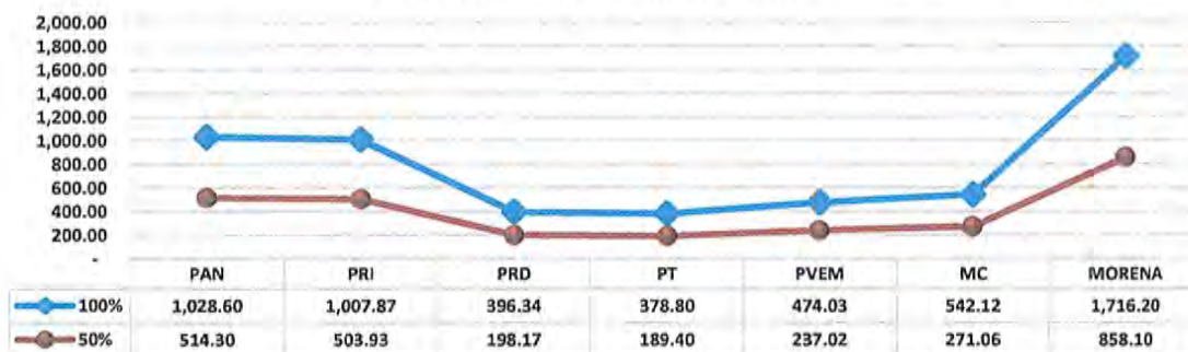
Gráfica No. 3. Financiamiento público para las actividades ordinarias permanentes de los partidos políticos nacionales de México, 2022. (MMDP).

Elaborado por la Subdirección de Análisis Económico de la Dirección de Servicios de Investigación y Análisis Especializados con información del INE.