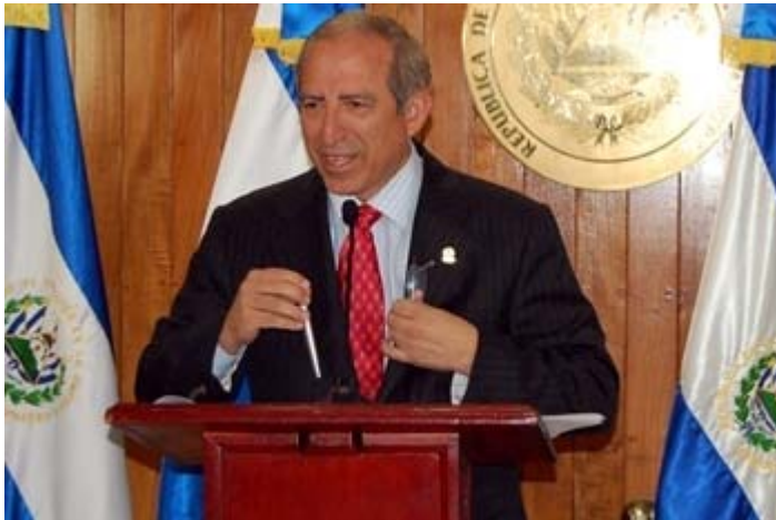
Sigfrido Reyes, Presidente de la Asamblea Legislativa. 14

Sigfrido Reyes, presidente de la Asamblea Legislativa se mostró optimista con la “Primera reunión interparlamentaria México y El Salvador”, a inaugurarse hoy y en la cual desarrollarán una agenda bilateral.