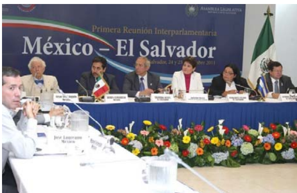
Concluye Primera Reunión Interparlamentaria El Salvador - México 13 25/10/2011