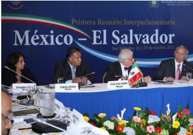
El Presidente Sigfrido Reyes durante su intervención en la reunión interparlamentaria 11 .

La Primera Reunión Interparlamentaria El Salvador-México fue inaugurada por el Presidente de la Asamblea Legislativa, Lic. Sigfrido Reyes, y por el Senador mexicano César Leal Angulo, en el marco del fortalecimiento de los lazos de amistad y cooperación entre ambos parlamentos 10