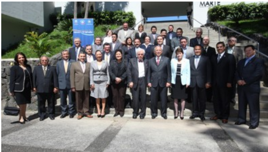
Parlamentarios salvadoreños y mexicanos participantes de la reunión.