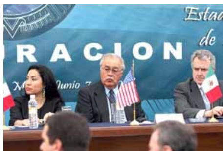
Ruth Zavaleta, Ed Pastor y Santiago Creel, durante la inauguración de la XLVII Reunión Interparlamentaria México-Estados Unidos, en Monterrey, Nuevo León.

Los legisladores que participan en la 47 Reunión Interparlamentaria México-Estados Unidos acordaron establecer un grupo binacional de trabajo en el tema migratorio, para que una vez que pase el proceso electoral estadounidense se pueda concretar la reforma en esa materia.