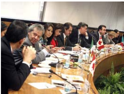
Aspecto de la XVII Reunión Interparlamentaria México-Canadá.