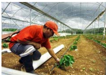
Trabajadores mexicanos en Canadá pueden ser deportados si se enferman. (Notimex)

CIUDAD DE MÉXICO (Notimex) — Casi 14,000 trabajadores migratorios mexicanos son explotados en campos agrícolas de Canadá, con jornadas de hasta 15 horas diarias, sin seguridad social, carentes de servicios médicos y con el riesgo permanente de la deportación, reveló un estudio de la Cámara de Diputados.