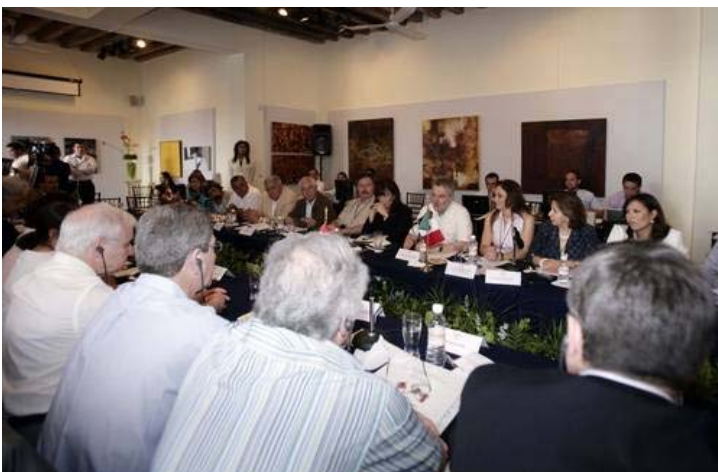
Aspecto de la XV Reunión Interparlamentaria México-Canadá

Al inaugurar este encuentro bilateral en Mazatlán, Sinaloa, la Embajadora Patricia Espinosa Cantellano, titular de la Secretaría de Relaciones Exteriores, señaló que el Programa de Trabajadores Agrícolas Temporales, con 34 años de existencia, se ha convertido en un símbolo de la relación.