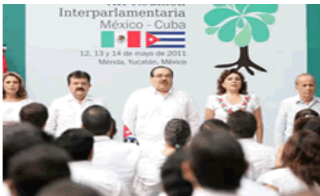
Foto: Archivo (Noticias de Chihuahua).- Legisladores de México y Cuba consideraron que el actual “es momento propicio” para superar el estancamiento que ha afectado las relaciones económicas entre los dos países en los últimos años.

En una declaración conjunta, al término de su XII Reunión Interparlamentaria, ambas delegaciones reiteraron su compromiso con la paz e hicieron un llamado a la solución pacífica de las controversias y de los conflictos entre las naciones o al interior de ellos.