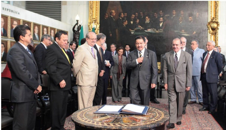
La segunda interparlamentaria México-Brasil tuvo sede en Brasilia.

(CNN México) — Los congresos de México y Brasil rechazaron la Ley de inmigración SB1070 promulgada en el estado de Arizona por considerarla violatoria de los derechos humanos e hicieron un llamado a derogarla.