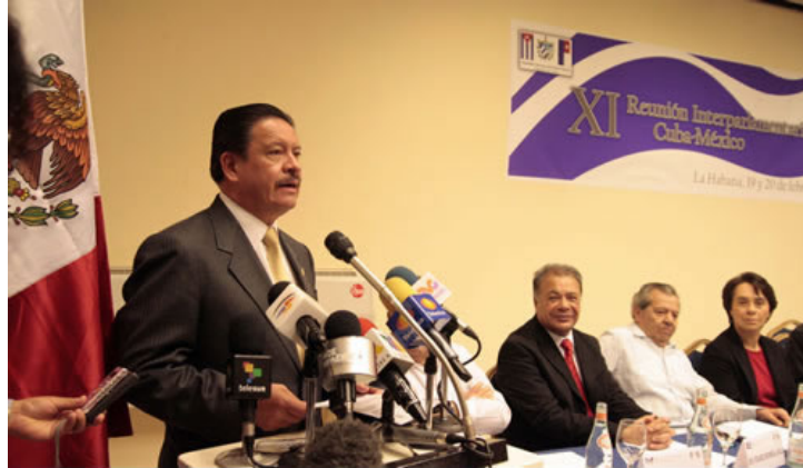
El presidente del Senado, Carlos Navarrete Ruiz, durante la inauguración de la XI Reunión Interparlamentaria Cuba-México, realizada en la ciudad de La Habana. (19/02/10)