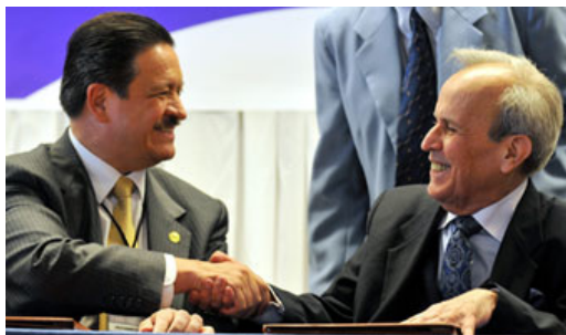
El presidente del Senado de México Carlos Navarrete (d) y el líder del Parlamento cubano, Ricardo Alarcón (i) en La Habana.

En otro apartado de la declaración, los magistrados se mostraron a favor de continuar con el compromiso de apoyar a Haití para lograr su reconstrucción, al tiempo que rechazaron el despliegue de bases militares estadounidenses en territorio latinoamericano.