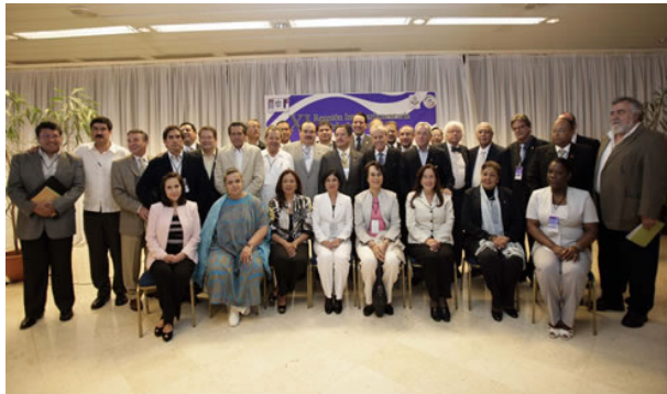
Al concluir los trabajos de la XI Reunión Interparlamentaria Cuba-México, realizada en La Habana, las delegaciones de ambos países refrendaron su condena al bloqueo económico que tiene Estados Unidos contra La Isla. (20/02/10)

Expresan rechazo a bases militares estadounidenses en América Latina: “son un riesgo”