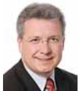
Ponente del PE: Dip. Marcus Ferber (PPE)