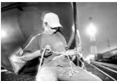
Un migrante centroamericano se amarra a un tren para atravesar territorio mexicano, en imagen de archivo 11

“Como lo atestigua el rescate de 200 migrantes centroamericanos (con su saldo de 5 muertos), atrapados en un vagón de tren cerca de Palenque, en abril de 2000, la migración internacional, especialmente en este espacio fronterizo se ha vuelto de alto riesgo (La Jornada, 13 de abril de 2001, pág. 45). Este incidente no es ni excepcional ni fortuito... En los últimos años la región divisoria entre México y Guatemala se ha convertido en uno de los cruces más difíciles y azarosos para los migrantes indocumentados, la mayoría proveniente de Guatemala, Honduras, El Salvador y Nicaragua. Ahí la multiplicidad de amenazas que enfrentan, incluyendo el asalto, el robo y los accidentes, por nombrar sólo algunas, hacen que esa región resalte precisamente por el alto riesgo que representa para los que intentan atravesarla.”