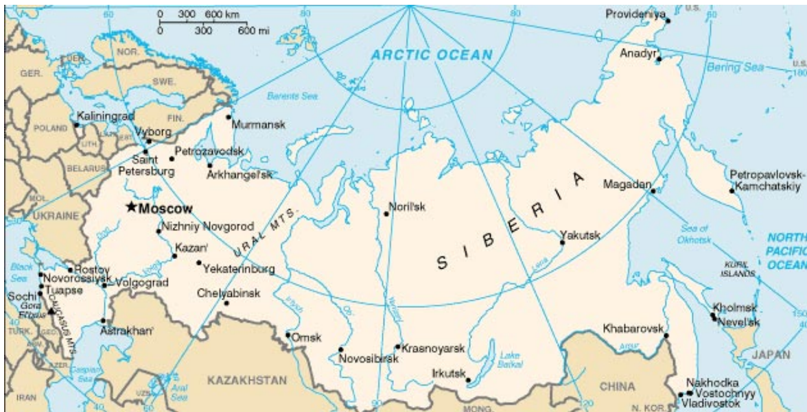
Mapa de la Federación Rusa y sus fronteras 1

Los conflictos entre distintos grupos nacionales de la ex Unión Soviética -que cobraron fuerza con la desaparición de este estado- nos dice la Guía del Mundo 2007 2 , se arrastran desde el siglo XIX, a raíz de la política expansionista del régimen zarista, proseguida por sus sucesores soviéticos. En momentos de su disolución, en octubre de 1991, la URSS era un vasto conglomerado que abarcaba más de 100 grandes etnias y casi 300 nacionalidades enmarcadas en 15 repúblicas socialistas soviéticas, dentro de las cuales se crearon 20 repúblicas autónomas, 8 regiones autónomas y 10 distritos autónomos (para los grupos étnicos pequeños, generalmente nómadas, de Siberia y el Extremo Oriente).