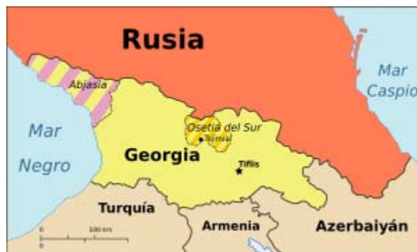
El Cáucaso 3

Con estos antecedentes de larga data, y que se pueden remontar a la constitución y las paulatinas anexiones del imperio zarista ruso que en muchas zonas resultó en etnias divididas por fronteras políticas pero no de lenguaje ni cultura y, más allá, a las sucesivas olas migratorias y colonizadoras que ha vivido el Cáucaso es que podemos aproximarnos a la reciente guerra de Georgia y la Federación Rusa. Acerquémonos a algunas referencias históricas significativas sobre Georgia, Osetia del Sur y Abjasia.