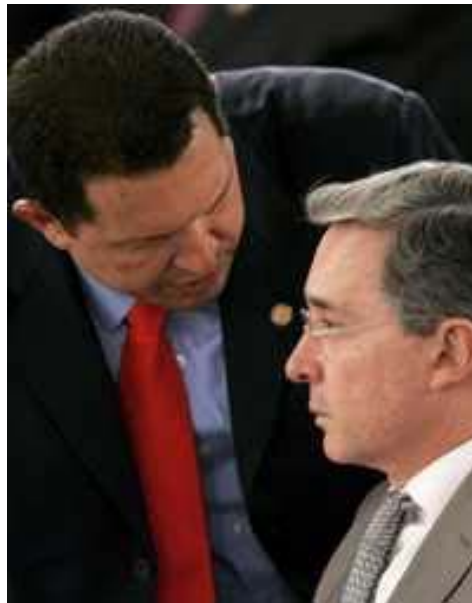
Los presidentes Chávez y Uribe dialogan en Santo Domingo después de la reconciliación Foto: Reuters. http://www.jornada.unam.mx/2008/03/08/index.php?section=mundo&article=025n1mun