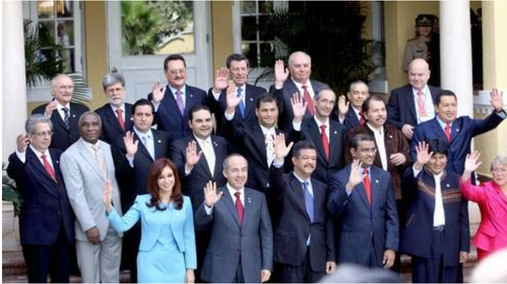
Fotografía oficial de la vigésima conferencia cumbre del Grupo de Río de Janeiro, que se celebró ayer en la capital de República Dominicana. http://www.jornada.unam.mx/2008/03/08/index.php?section=mundo&article=024n1mun