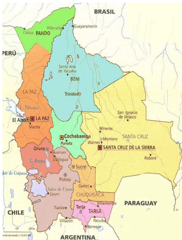
MAPA DE LA REPÚBLICA DE BOLIVIA 14

La respuesta del Gobierno emitida por el Vicepresidente de la República, Álvaro García Linera fue: "La ley no dice que el referendo es por cantón, por barrios, por casas, por cuartos como quieren imaginar un par de despistados y desubicados dirigentes cívicos, porque la circunscripción es nacional y lo que cuenta es el resultado nacional" 15 .