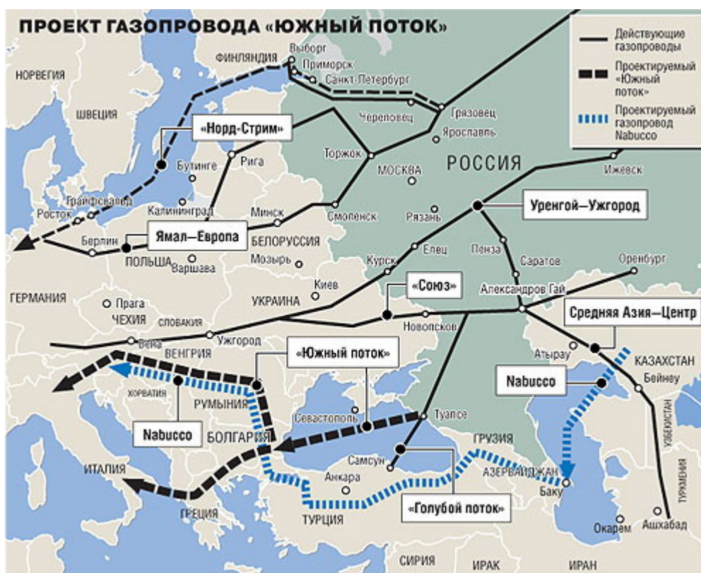
Nabucco, Nord, South and Blue Streams 3