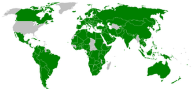
Mapa de los estados miembros de la UIP