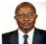
Vicepresidente de la GOPAC Augustine Ruzindana (ex diputado, Uganda) Presidente, APNAC

Fue senador de 200 a 2006 y Diputado Federal de la Lx legislatura (2006-2009) donde presidió la Comisión de Justicia. Formó parte de las comisiones de Gobernación y de Relaciones Exteriores. Representó al congreso mexicano ante la Unión Interparlamentaria Mundial. Además, es presidente interino del capítulo latinoamericano del Grupo Mundial de Parlamentarios contra la Corrupción (GOPAC).