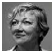
Miembro del Comité Ejecutivo de la OMPCC Ex Senadora Mary K. King, Trinidad y Tobago Presidenta Interina de la Sección del Caribe

gobierno unos 22.000 millones de pesos al año, que pueden utilizarse para construir más salas de clases y otras obras de infraestructura. El Senador Angara también fue el primer Presidente de la organización de Parlamentarios de Asia Sudoriental contra la Corrupción o PASOCC.