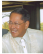
Senador Edgardo J. Angara Presidente de SEAPAC

Edgardo J. Angara se graduó en la Universidad de Filipinas (Derecho, 1958), y la Universidad de Michigan (Magister de Derecho, 1964), y ex Rector de la Universidad de Filipinas. El Senador Angara fue elegido por primera vez al Senado en 1987. Como legislador, Angara ha redactado y auspiciado muchas leyes importantes en educación, salud, las artes, cultura, bienestar social, economía y agricultura. Angara, un activo luchador contra la corrupción, principalmente redactó y auspició la Ley de Reforma de las Adquisiciones de Gobierno. La principal medida contra la corrupción en la historia del país, esa ley ahorrará al