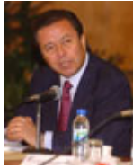
GOPAC Executive Committee Member Diputado Cesar Camacho, México Interim Chair LAPAC

Mexiquense. Licenciado en Derecho por la Universidad Autónoma del Estado de México, en donde también es profesor titular por oposición de las cátedras de Derecho Administrativo en la Facultad de Derecho, y de Derecho Constitucional y de Sistema Jurídico de la Administración Pública en la Facultad de Ciencias Políticas y Administración Pública.