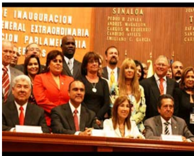
Legisladores de toda América durante la inauguración de la asamblea extraordinaria de la COPA en Querétaro.

Argentina Bolivia Chile Colombia Ecuador El Salvador México Paraguay Venezuela Ciudad de México, mayo de 2010