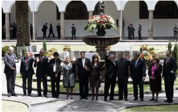
Mandatarios sudamericanos al celebrar ayer en Quito la tercera cumbre De la Unasur. En el extremo derecho, Manuel Zelaya, invitado al encuentro

Quito, 10 de agosto. Brasil pidió hoy a los integrantes de la Unión de Naciones Sudamericanas (Unasur) que convoquen a Estados Unidos a un diálogo sobre su plan para ampliar las facilidades militares estadounidenses en siete bases de Colombia, proyecto que no fue objeto de una condena explícita en la declaración final de la tercera cumbre de mandatarios de la región, celebrada hoy aquí, a pesar de las peticiones hechas por Venezuela y Bolivia.