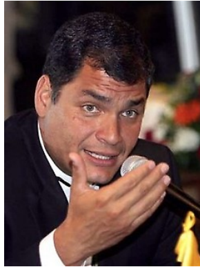
El presidente de Ecuador Rafael Correa

Quito, ago 8 de 2009.- El Gobierno de Ecuador asumirá el lunes la dirección de la Unión de Naciones Suramericanas (UNASUR) con el reto de solidificar su estructura y construir sus instituciones fundamentales