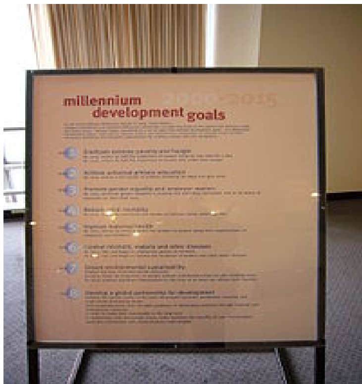
Objetivos enlistados en la ONU