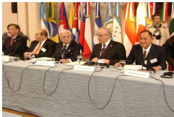
Integrantes de Coppel e Icapp

Lo llevaron a cabo ayer los integrantes de la COPPPAL y la ICAPP en la cancillería Argentina. Un evento que contó con la presencia de muchos partidos políticos de Latinoamérica, Caribe y Asia Pacífico. Hoy, será el cierre. Serán recibidos por Cristina y estará Scioli. Por: Mariano Gandini