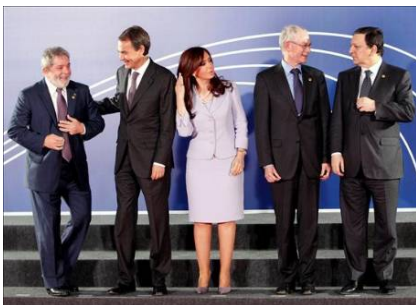
Foto de familia de la cumbre UE-ALC. 18-05-2010

Los principales líderes de la Unión Europea, Latinoamérica y Caribe coincidieron este martes en resaltar el "éxito" de la Cumbre birregional celebrada en Madrid porque ha sido "de resultados y acuerdos" en numerosos ámbitos, y ha servido para afianzar alianzas en foros económicos y medioambientales globales.