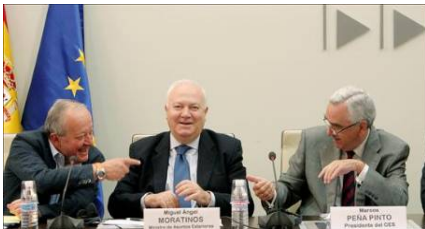
El presidente del Comité Económico y Social Europeo, Mario Sepi (izda), el ministro español de Asuntos Exteriores, Miguel Ángel Moratinos (centro), y el presidente del Consejo Económico y Social español, Marcos Peña (dcha).

La VI cumbre UE-Latinoamérica y Caribe, que comenzará el 17 de mayo en Madrid, será "una cumbre histórica que la Presidencia Española quiere dejar como uno de sus hitos en las relaciones entre la Unión Europea y América Latina", manifestó el ministro español de Asuntos Exteriores, Miguel Ángel Moratinos.