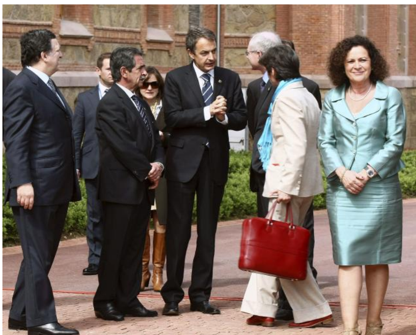
La Unión Europea y México inauguran la cumbre que impulsará su asociación estratégica 13

Este evento, organizado por el Consejo Empresarial Mexicano de Comercio Exterior, Inversión y Tecnología (COMCE) y el Consejo Superior de Cámaras de Comercio de España y ProMéxico, han participado alrededor de 20 empresas y 35 representantes de compañías españolas con el fin de analizar esas posibilidades en campos como la energía, infraestructuras o la innovación y que las empresas españolas puedan participar en el Plan Nacional de Infraestructuras 2007-2012.