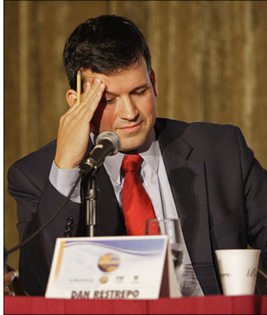
Dan Restrepo, consejero adjunto de Seguridad Nacional de la Casa Blanca para América Latina, participa en la Cumbre de las Américas celebrada en Miami, en el 2008.