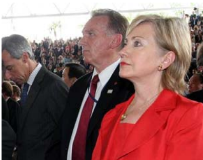
La secretaria estadounidense de Estado, Hillary Clinton, durante la toma de posesión del presidente salvadoreño, Mauricio Funes

San Salvador. La secretaria de Estado Hillary Clinton declaró ayer aquí que Washington “está listo” para colaborar con el nuevo gobierno de Mauricio Funes e hizo un público reconocimiento a la “transparencia, vitalidad y compromiso” del primer mandatario de izquierda de El Salvador, definido más bien por la moderación. Al término de una reunión con el nuevo gobernante, anunció también que había transmitido a Funes la invitación del presidente Barack Obama para hacer una visita oficial a Washington tan pronto como las agendas lo permitan.