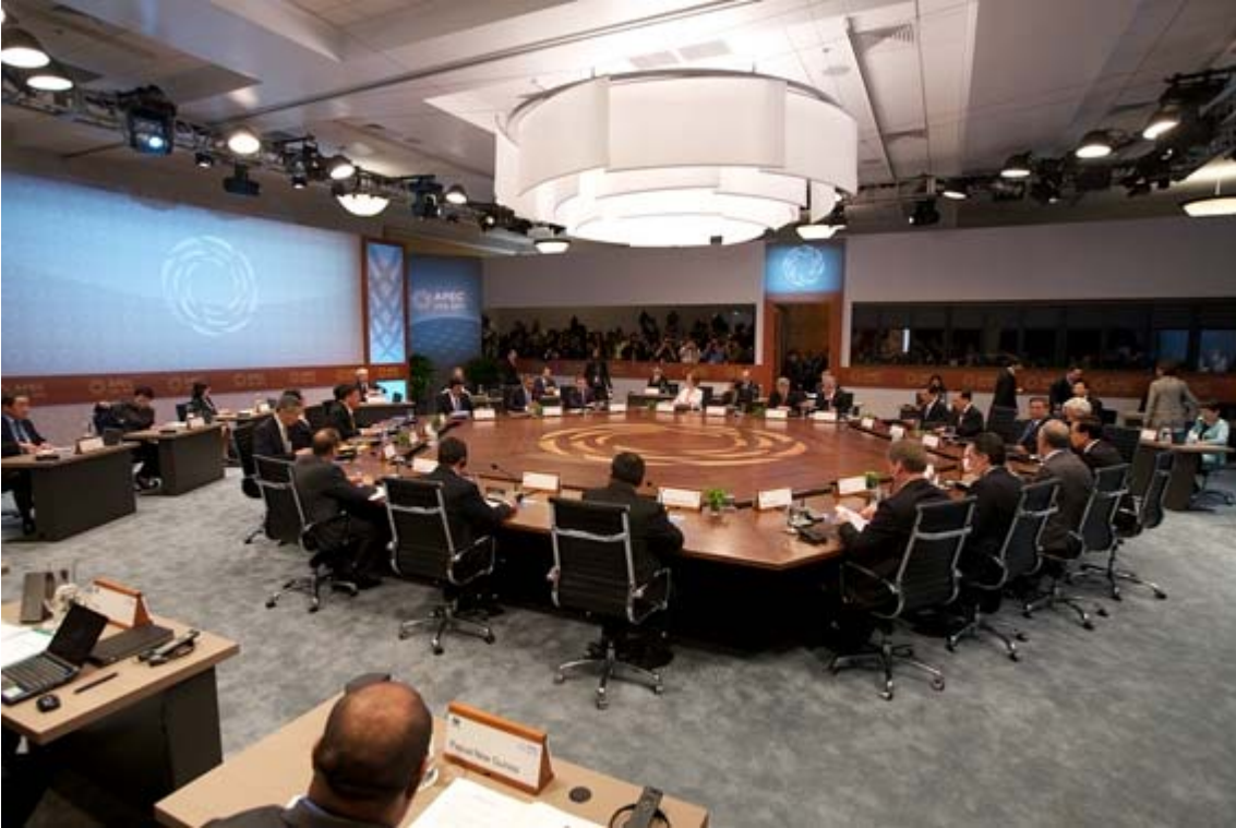
Líderes de APEC se reúnen en Honolulu, Hawaii

XIX Reunión de Líderes Económicos del Mecanismo de Cooperación Económica Asia Pacífico (APEC) Honolulu, Estados Unidos. 12 y 13 de Noviembre del 2011