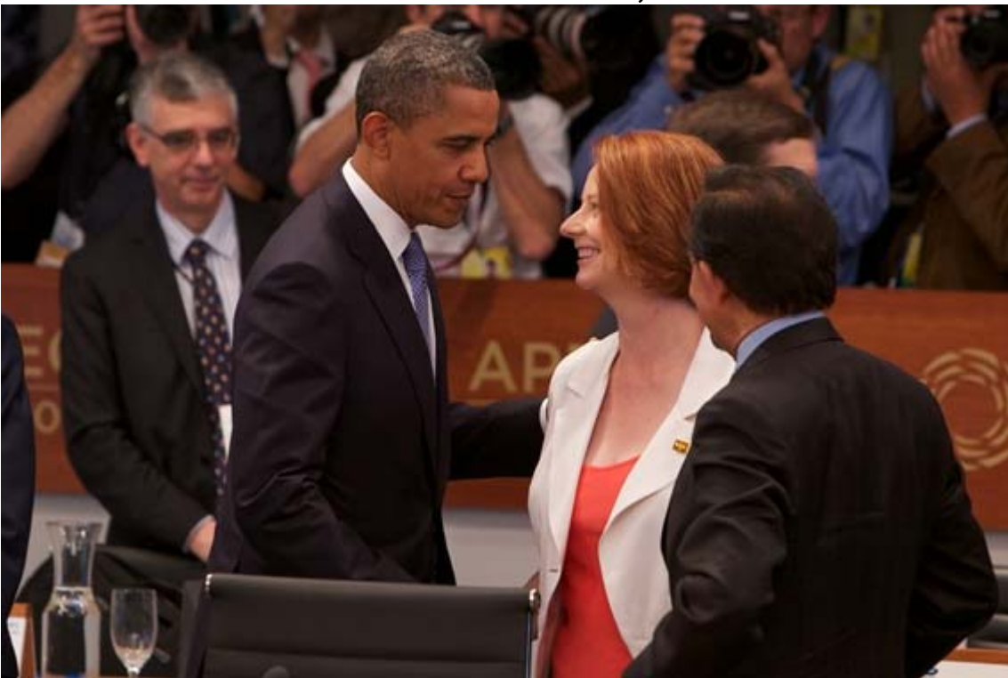
EE.UU. El presidente Barack Obama (izquierda), Primer Ministro de Australia Julia Gillard (derecha)