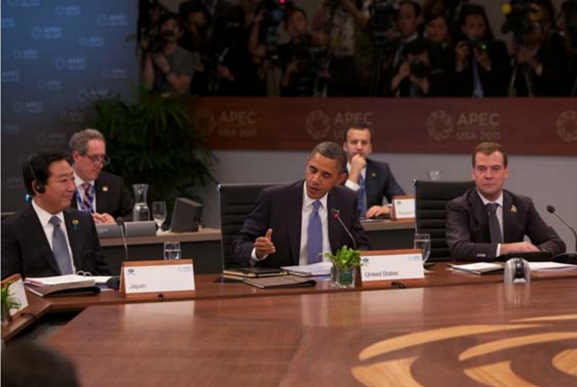
El primer ministro japonés, Yoshihiko Noda, (izquierda), EE.UU. El presidente Barack Obama (centro), el presidente ruso, Dmitry Medvedev (derecha)

XIX Reunión de Líderes Económicos del Mecanismo de Cooperación Económica Asia Pacífico (APEC) Honolulu, Estados Unidos. 12 y 13 de Noviembre del 2011