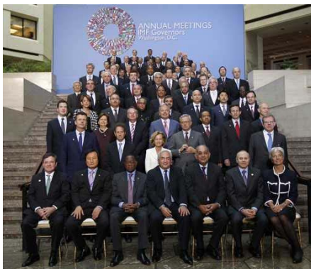
Participantes en la reunión anual del Banco Mundial y el Fondo Monetario Internacional