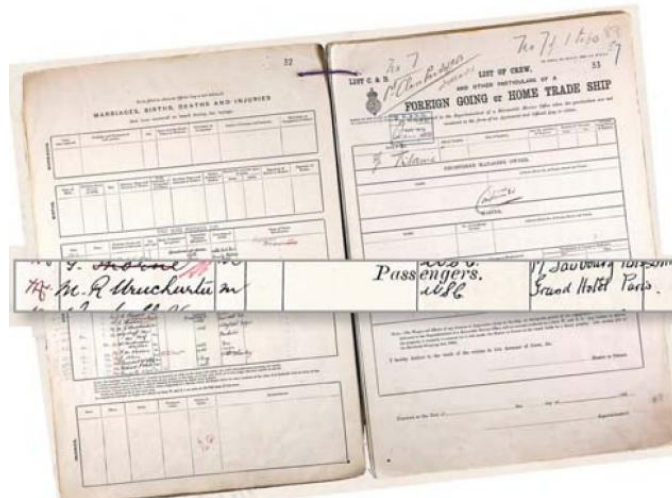
Relación de los pasajeros fallecidos.

Esta es la historia un caballero que lo tenía todo y por un gesto de nobleza hacia una dama desesperada dejó puesto, fortuna, mujer e hijos: es por ello que esta historia que nos dejó es y será inmundible.