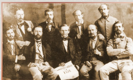
Constituyente de 1857