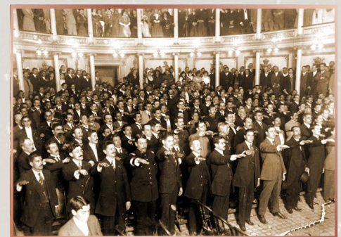
Constituyente de 1916-1917