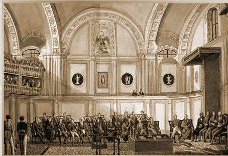
Antiguo Colegio de San Pedro y San Pablo