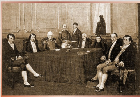
Junta Provisional Gubernativa