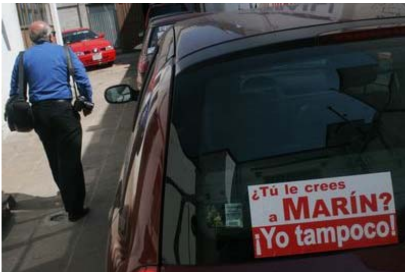
Protesta vehicular en la capital poblana