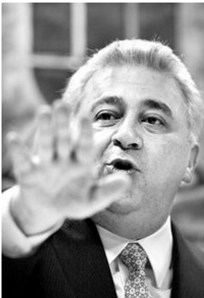
Emilio Chuayffet

El coordinador del grupo parlamentario del PRI en la Cámara de Diputados, Emilio Chuayffet, calificó al presidente Vicente Fox de cínico y hombre de doble moral por mantener a Miguel Angel Yunes, secretario ejecutivo del Consejo de Seguridad Nacional, al frente de la cartera que lucha contra la delincuencia organizada, cuando a éste se le menciona en el libro de la periodista Lydia Cacho, como participante de una red de pederastas.