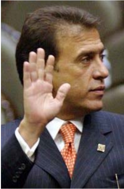
Miguel A. Yunes

Al concluir la sesión, una vez que Yunes respondió mediante una carta, Chuayffet dijo: "Hablar de Yunes achaparra". El diputado no conocía a esa hora, 15:30, la misiva. En la sala de prensa ya había copia con sello de recibido de la oficina del legislador. Los funcionarios de SSP se dedicaron posteriormente a repartir el documento.