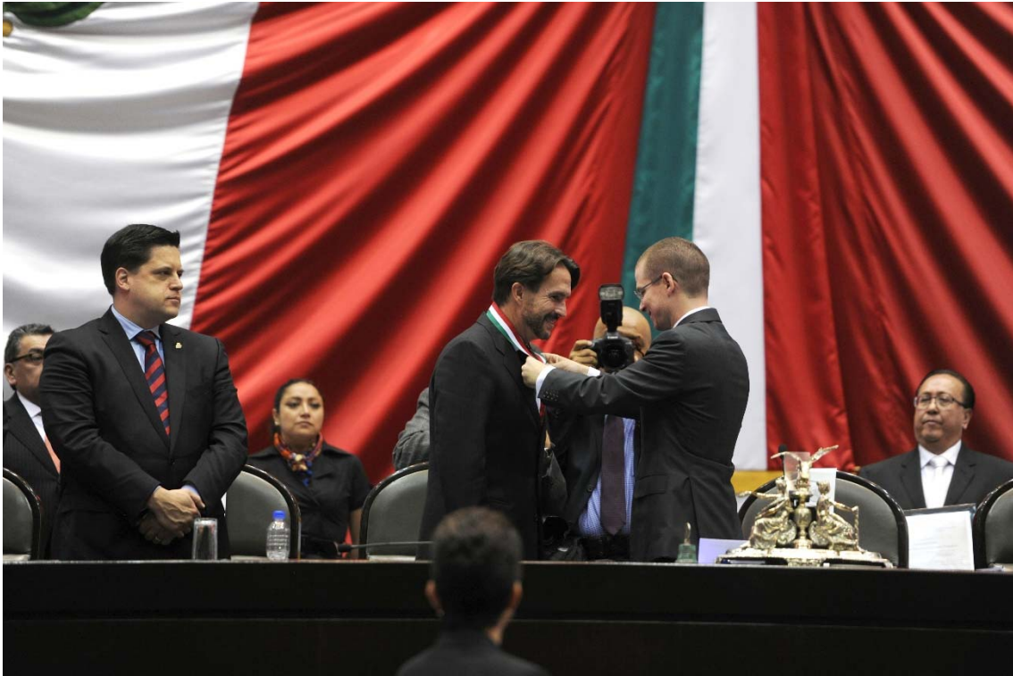
Entrega de la medalla.