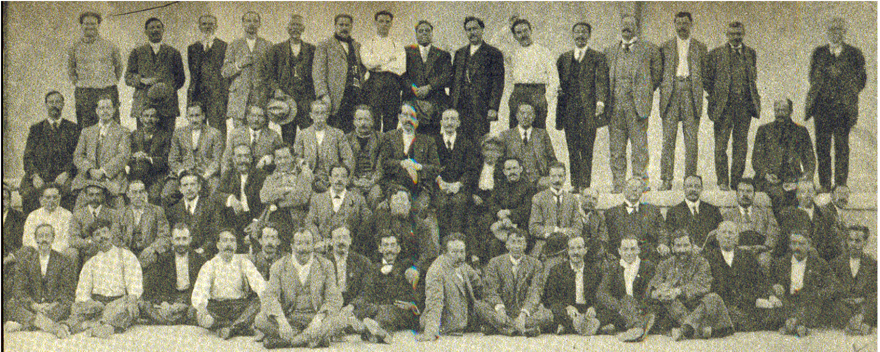
Diputados de la XXVI Legislatura, encarcelados en Lecumberri.