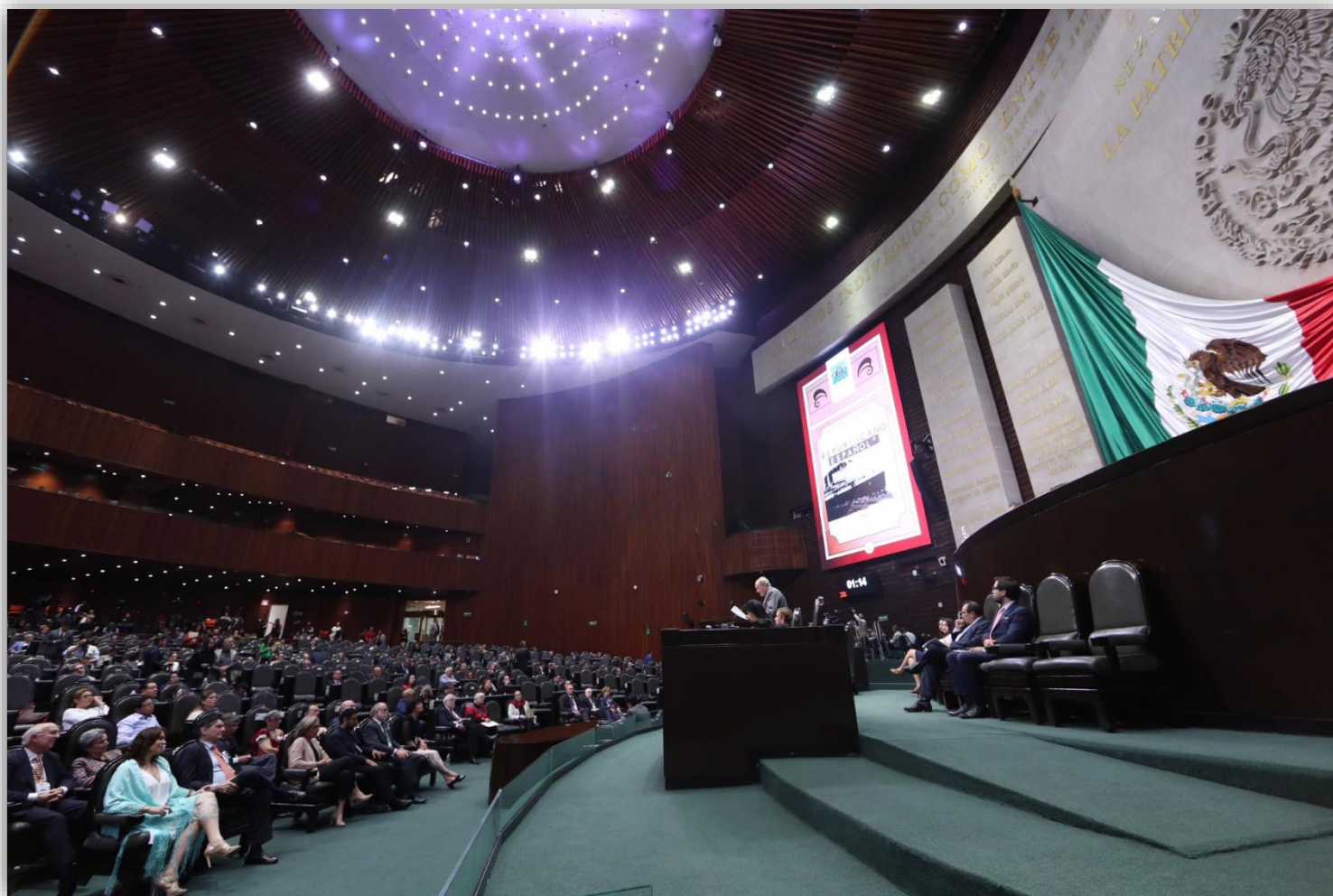
Sesión solemne develación de la leyenda: Al Exilio Republicano Español