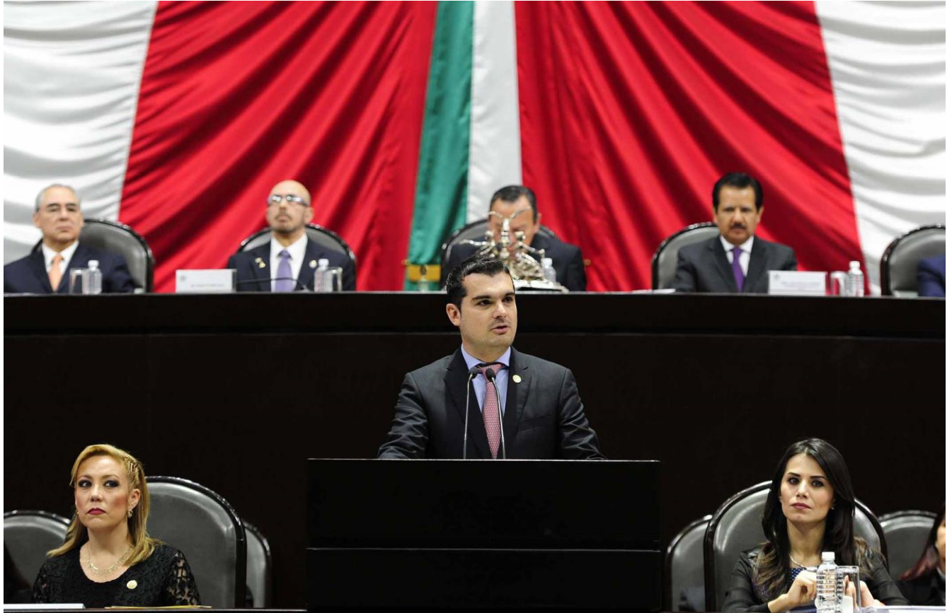
Intervención del Diputado Jorge TrianaTena, Presidente de la Comisión de Régimen, Reglamentos y Prácticas Parlamentarias.