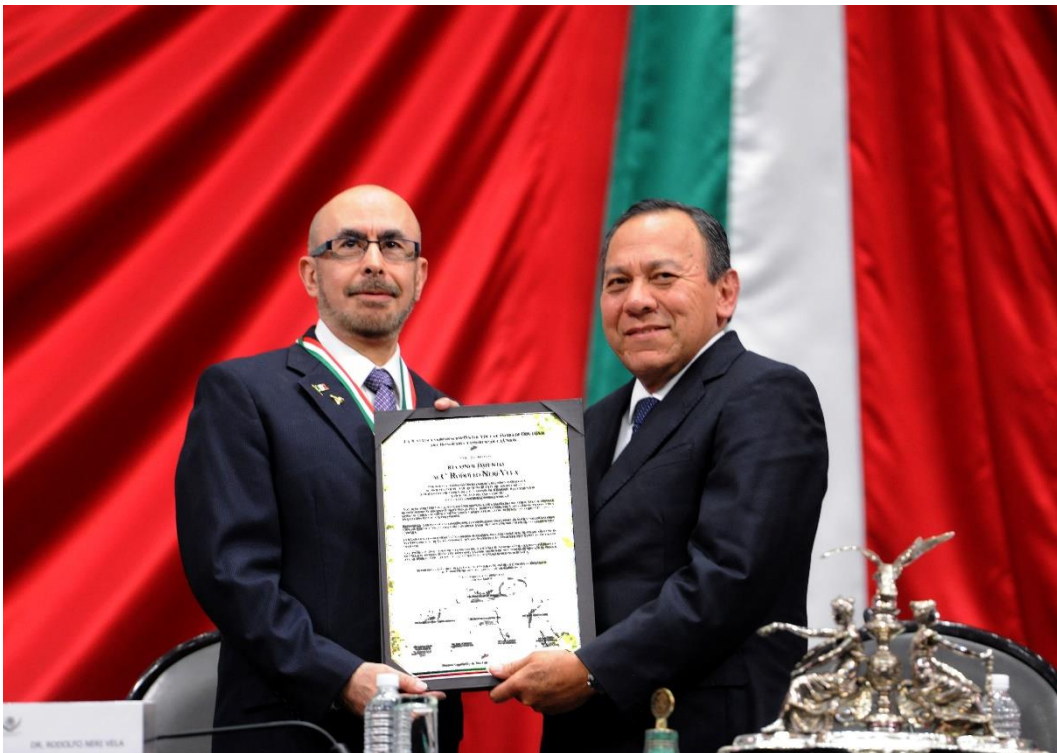
Entrega de la medalla y pergamino.