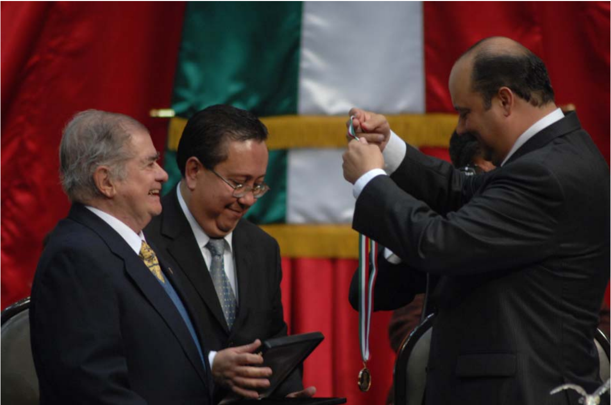
El Presidente de la Mesa Directiva, Dip. César Duarte Jáquez, poniendo la Medalla al Mérito Cívico “Eduardo Neri, Legisladores de 1913” al Dr. Miguel Luis León y Portilla.