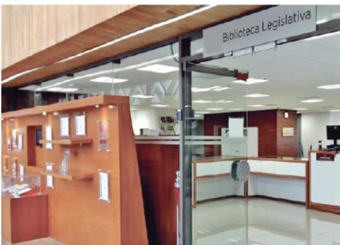
○ BIBLIOTECA LEGISLATIVA / CÁMARA DE DIPUTADOS

· Creada por la Ley Orgánica del Congreso General de los Estados Unidos Mexicanos de 1999, haciendo de ésta un órgano de trabajo conjunto que, por primera vez en la historia, reunía la participación de las dos Cámaras del Congreso de la Unión, en relación a sus acervos bibliotecarios.