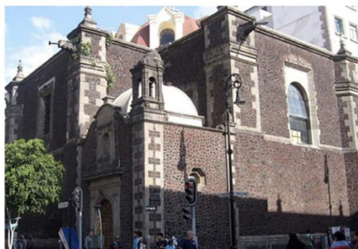
○ BIBLIOTECA GENERAL DEL H. CONGRESO DE LA UNIÓN / CÁMARA DE DIPUTADOS