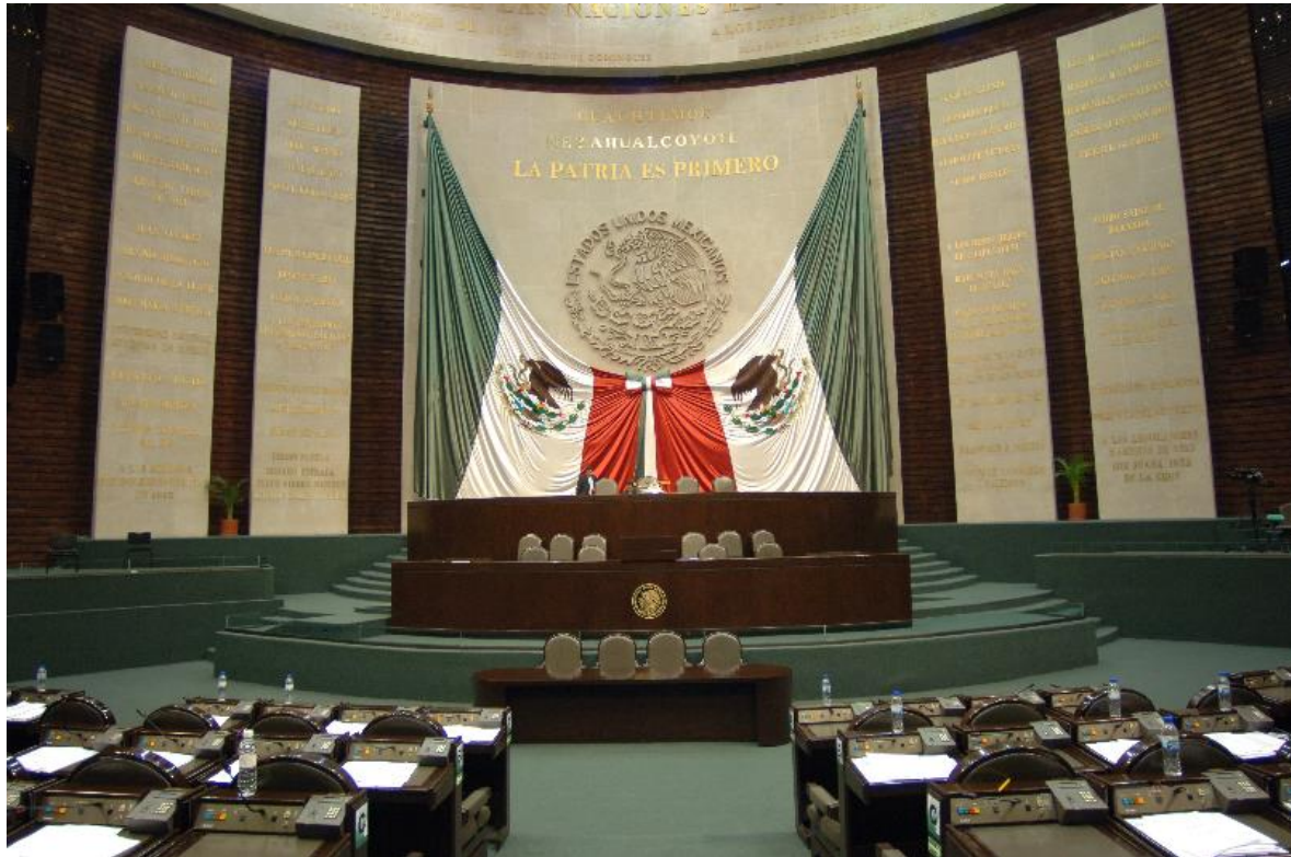
Pleno del Palacio Legislativo de San Lázaro de la H. Cámara de Diputados

Pulsa el siguiente link para contestar un diagnóstico de la utilidad de este documento: