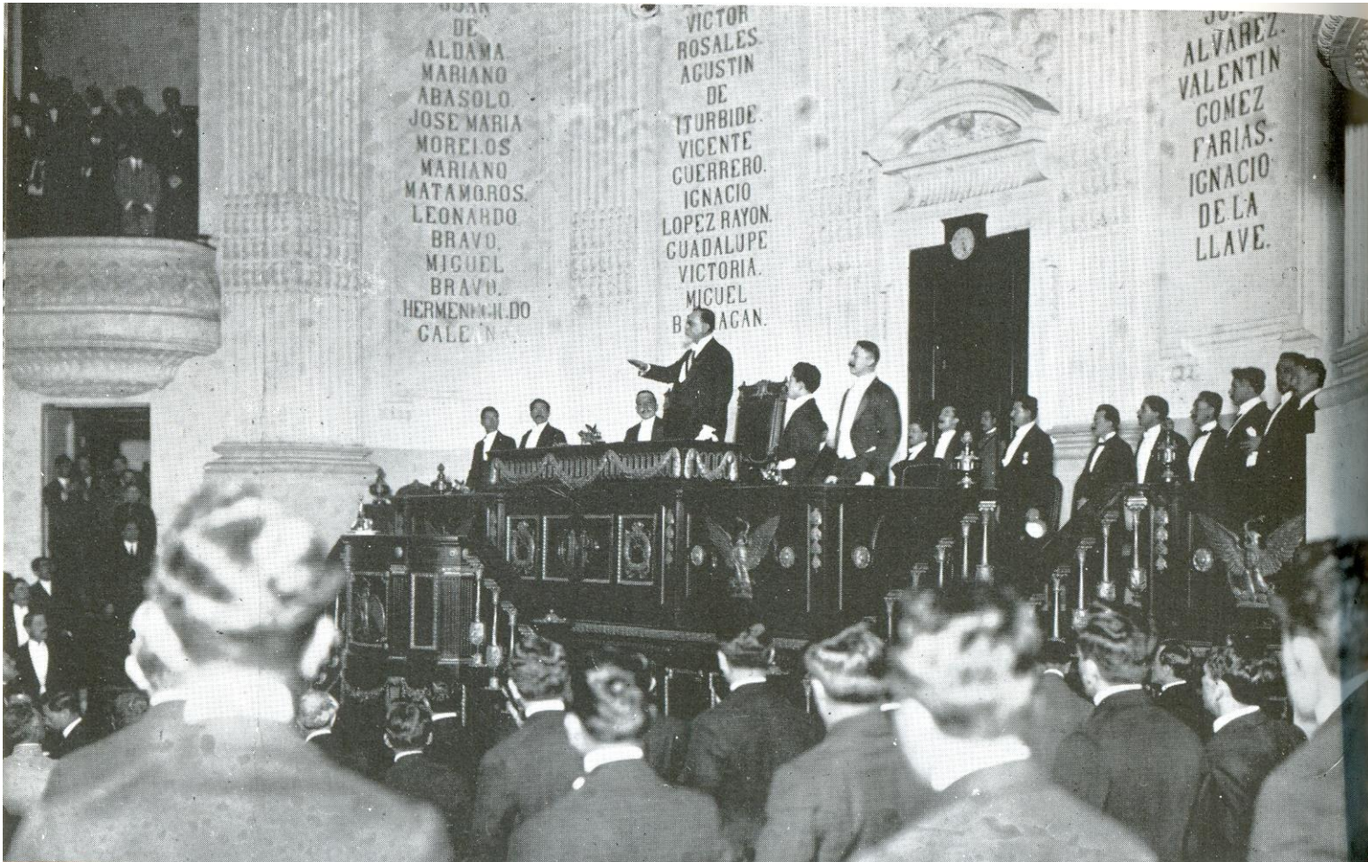
Pleno de la H. Cámara de Diputados en el Recinto de Donceles, 1917

Pulsa el siguiente link para contestar un diagnóstico de la utilidad de este documento: