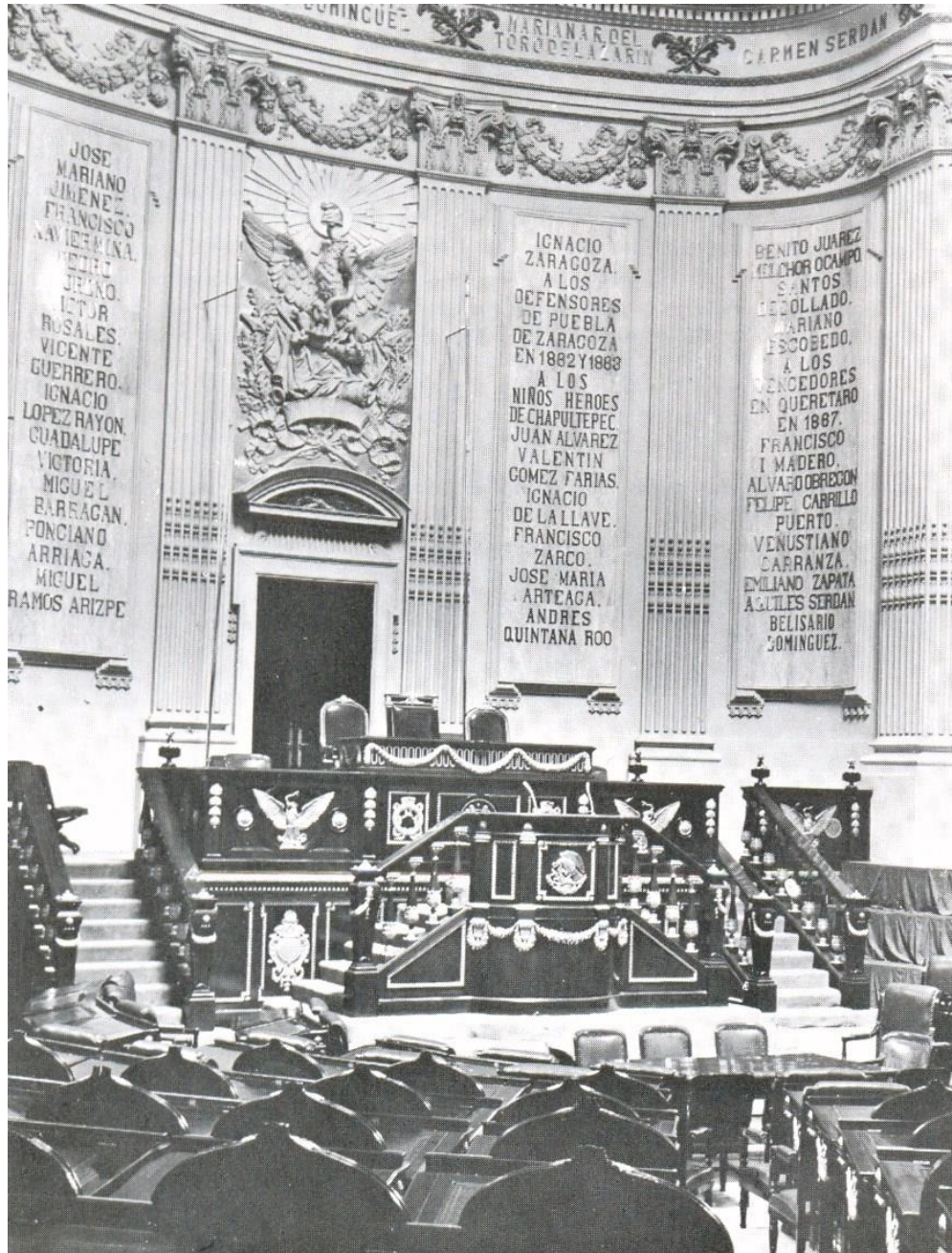
Pleno de la H. Cámara de Diputados en el Recinto de Donceles, 1961

Pulsa el siguiente link para contestar un diagnóstico de la utilidad de este documento: