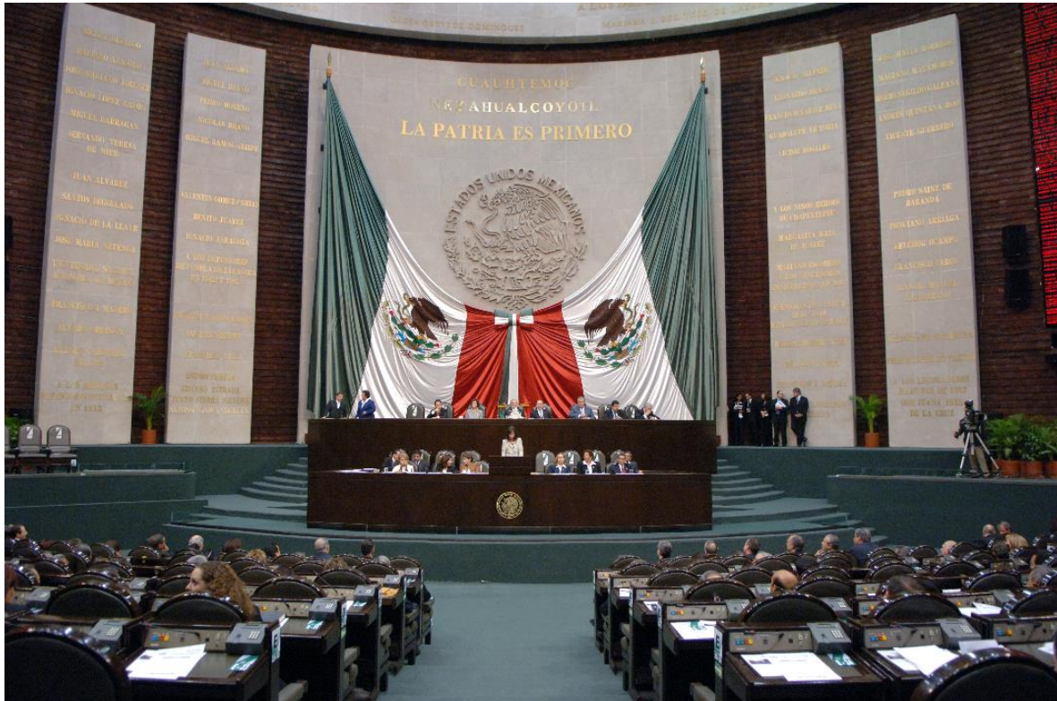
Pleno del Palacio Legislativo de San Lázaro de la H. Cámara de Diputados

Pulsa el siguiente link para contestar un diagnóstico de la utilidad de este documento: