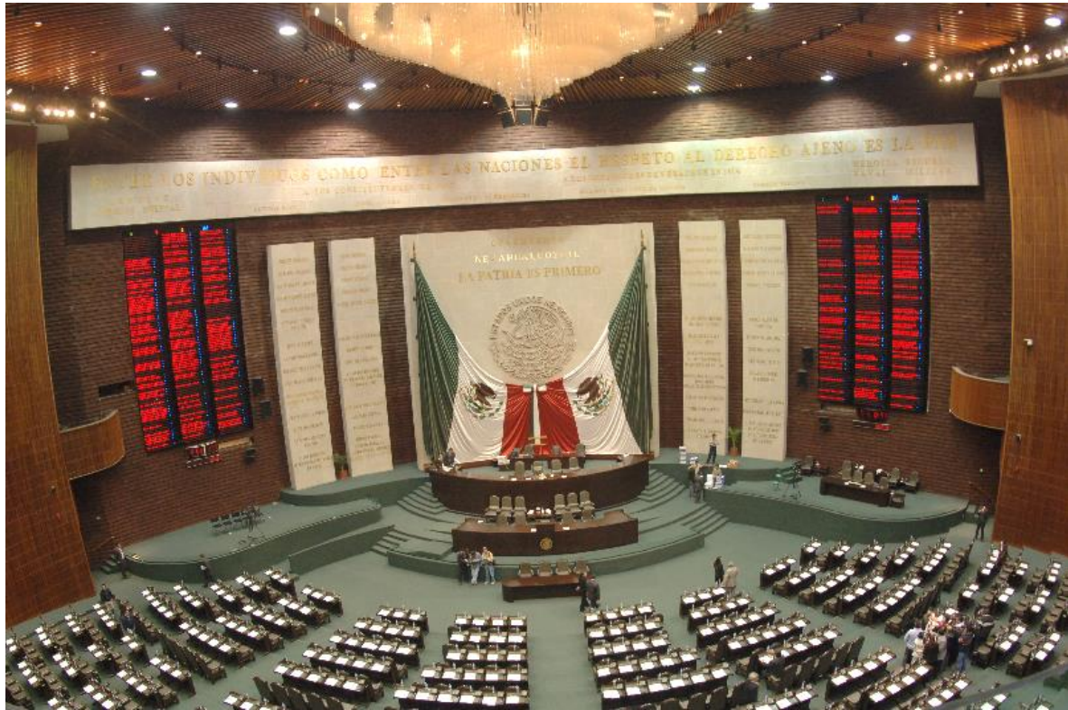
Pleno del Palacio Legislativo de San Lázaro de la H. Cámara de Diputados

Pulsa el siguiente link para contestar un diagnóstico de la utilidad de este documento: