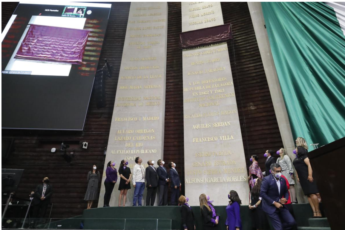
Pleno del Palacio Legislativo de San Lázaro de la H. Cámara de Diputados

Agradecemos el material visual a la Coordinación de Comunicación Social de esta H. Cámara de Diputados.