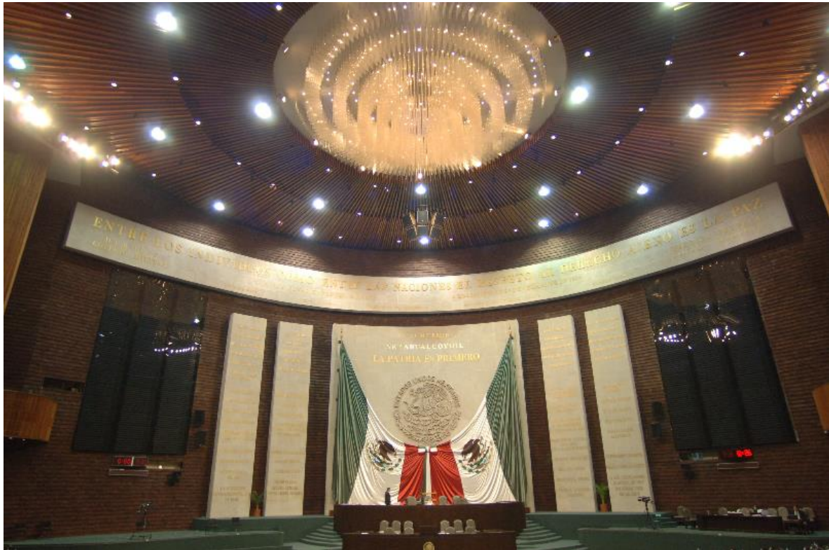
Pleno del Palacio Legislativo de San Lázaro de la H. Cámara de Diputados

Pulsa el siguiente link para contestar un diagnóstico de la utilidad de este documento: