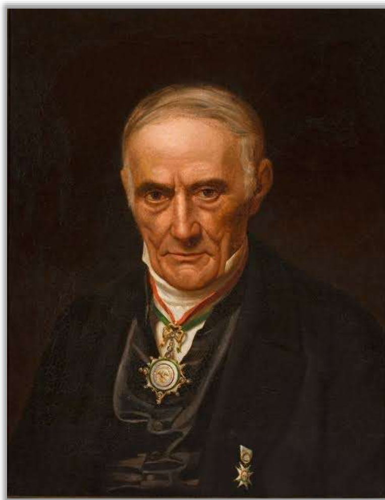
Andrés Quintana Roo.