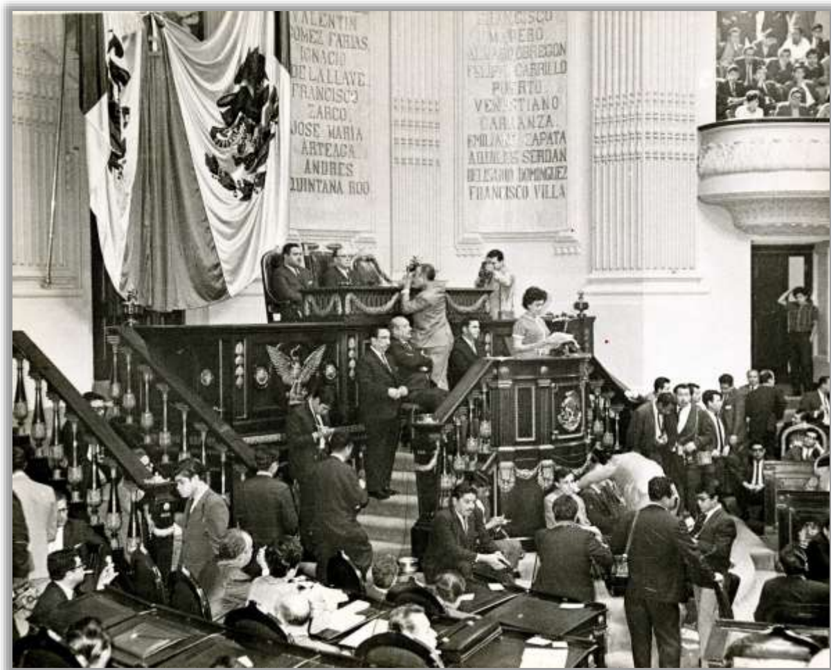
Letras de oro Andrés Quintana Roo en el salón de sesiones de la Cámara de Diputados, recinto legislativo de Donceles