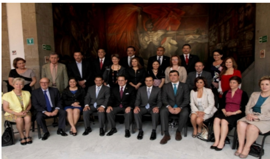
Foto oficial de la XV Reunión Parlamentaria México-Unión Europea.

El 2 de mayo de 2013, Legisladores de México y la Unión Europea dieron inicio a los trabajos de la versión XV de la CPM, la cita fue en la calle de Xicoténcatl No. 9, Colonia, Centro, Ciudad de México. Los temas agendados fueron; la evaluación del “Acuerdo de Asociación Económica, Concertación Política