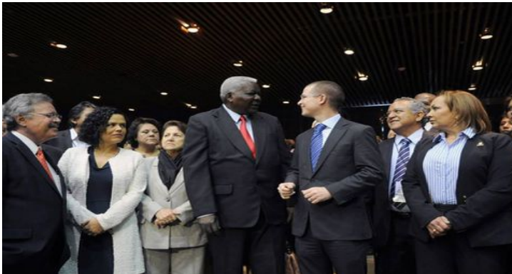
Reunión interparlamentaria México-Cuba en San Lázaro. (Especial)

El presidente de la Cámara de Diputados señaló que el país avanza por buen camino y para que siga así es necesario crear las legislaciones secundarias de las recientes reformas constitucionales.