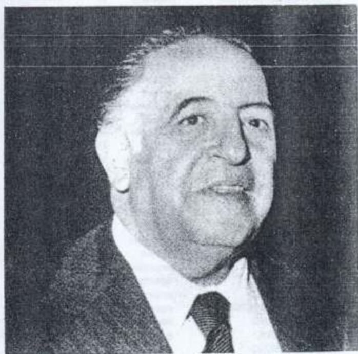
Jesús Reyes Heróles