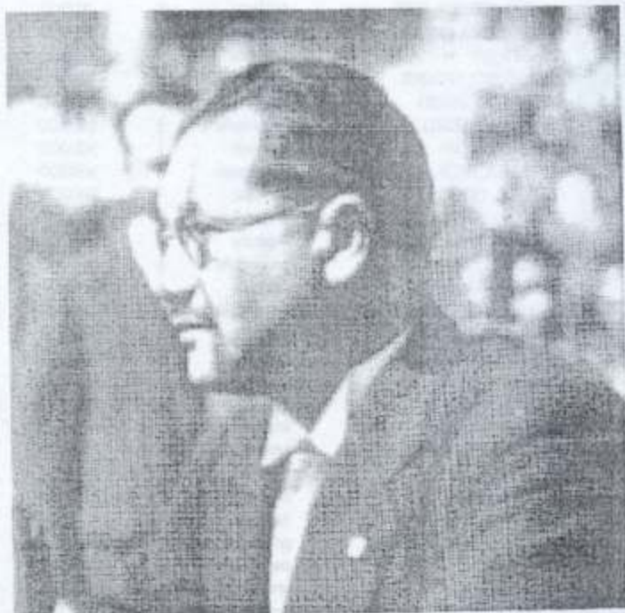
Marte R. Gómez