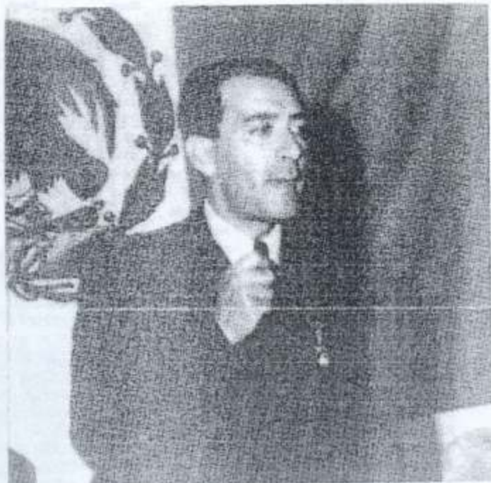
Vicente Lombardo Toledano