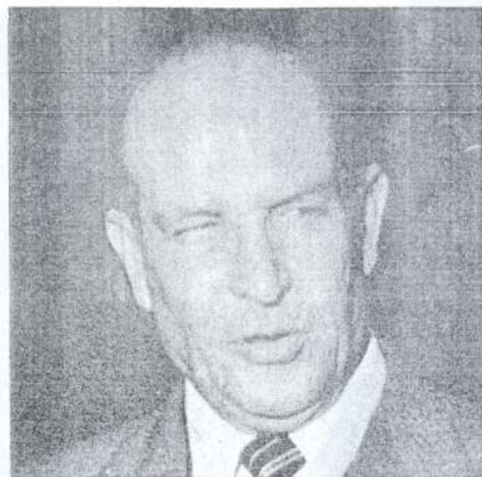
Efraín González Luna