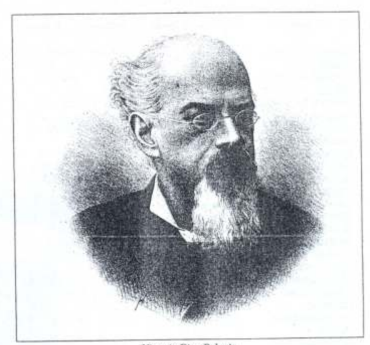
Vicente Riva Palacio