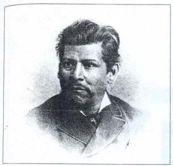
Ignacio Manuel Altamirano