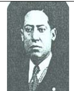
DIP. JACINTO R. PALACIO