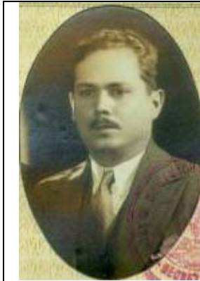
GRAL DIP. ARTURO CAMPILLO SAYDE