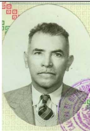
GRAL. DIP. JUVENCIO NOCHEBUENA